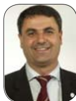
Ibrahim Baylan (s)